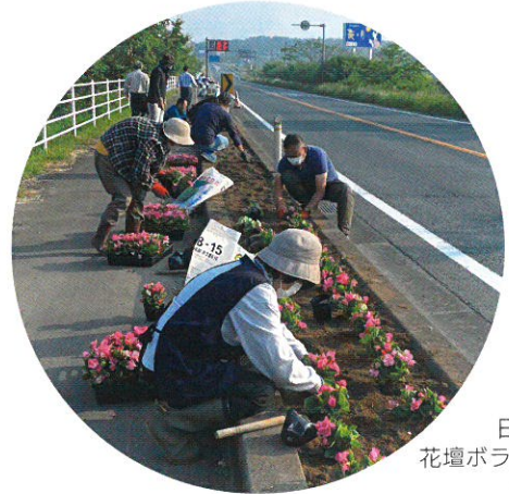
日立木6号 花壇ボランティア (福島県)