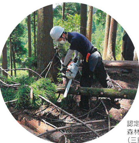
認定NPO法人 森林の風 (三重県)

A 助成対象は申請した活動にかかる経費に限定されます。例えば、事務所のコピー機で印刷する場合、申請活動で使用する分とそれ以外の使用分を分けられるのであれば申請できます。