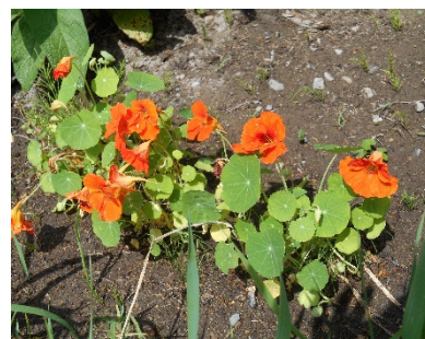
管理人さん丹精の花