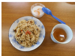
ひじき入り炊き込みご飯と牛乳寒天、お茶

●6月25日(火)10時から和室1号室で開かれました。参加者10名でした。常連の2名が都合で参加できず、寂しかったですが、みんなで楽しく話し合うことができました。ランチはひじきの炊き込みご飯と牛乳寒天でした。