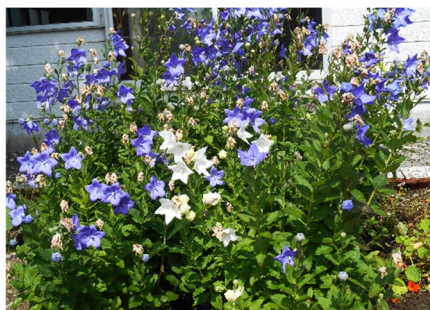
7月猛暑で早枯れ始めた桔梗