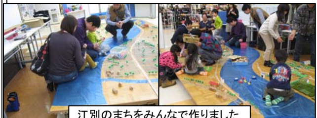
江別のまちをみんなで作りました

参加者みんなで、江別の歴史を考えながら何も出来ていなかったまちから徐々に作りこみ住みたいまち江別に変えました。