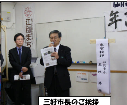
三好市長のご挨拶