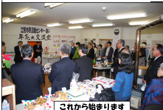
これから始まります

昨年末 12月16日(金)18:00 からセンター交流サロンで「年忘れ交流会」が開かれました。大震災があつて大変な年でしたが、大勢のお客様に参加していただき、楽しく歓談することができました。ひと足早く年越しそばも出て、食べて話して、時間の経つのが早かったです。終了予定時間になり、みなそれぞれに2012年の飛躍を約して散会しました。来館していただいた皆様、有難うございました。