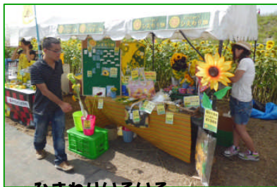
ひまわりいろいろ