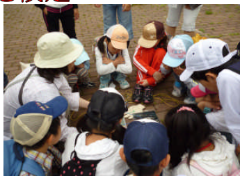
出発前のミーティング

2回目はふれあい交流館でお話を聞き、そのあと野幌森林公園の中に入り、木や葉を視たり、ふれたりする自然体験をしました。