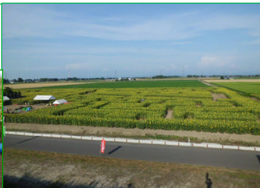
今年の迷路は難しかったそう