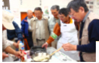
テンブラ、味噌漬け、キノコ汁... センターでの試食会は大騒ぎ